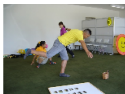
遊びを取り入れながら体幹を鍛えます

7月から開所されています。お試し体験の後、気に入れば契約という流れになります。見学に来て、障がい者サービス受給者証が必要になることを知り急いで手続きをされる方もいるようです。